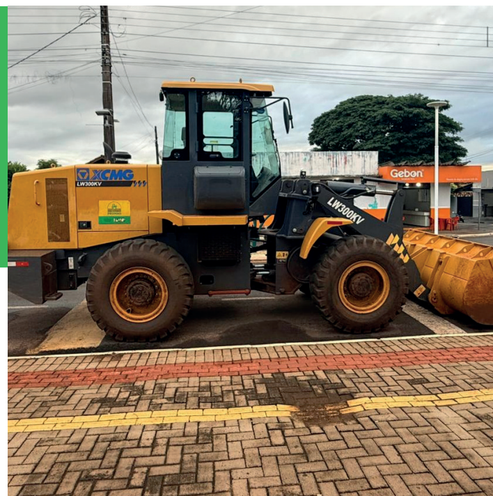
Pá carregadeira, 0 KM, no valor de R$ 420 mil, emenda da deputada federal Luiza Canziani