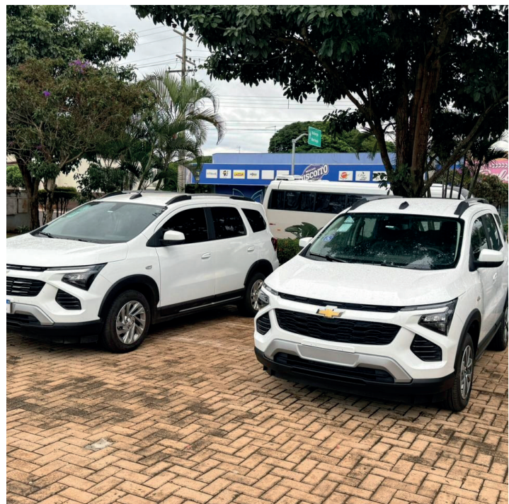
Dois veículos GM Chevrolet Spin com capacidade para sete lugares, uma no valor de R$ 146 mil e a outra (adaptada) no valor de R$ 250 mil