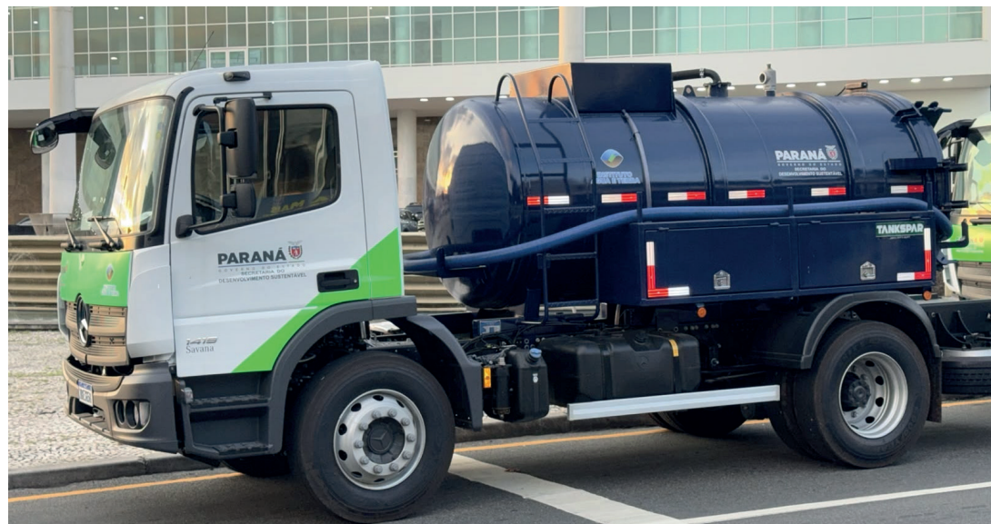
Caminhão Limpa Fossa, no valor de R$ 476 mil