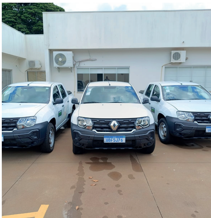
Três veículos Pick-Up Renault Orochi, no valor de R$ 375 mil