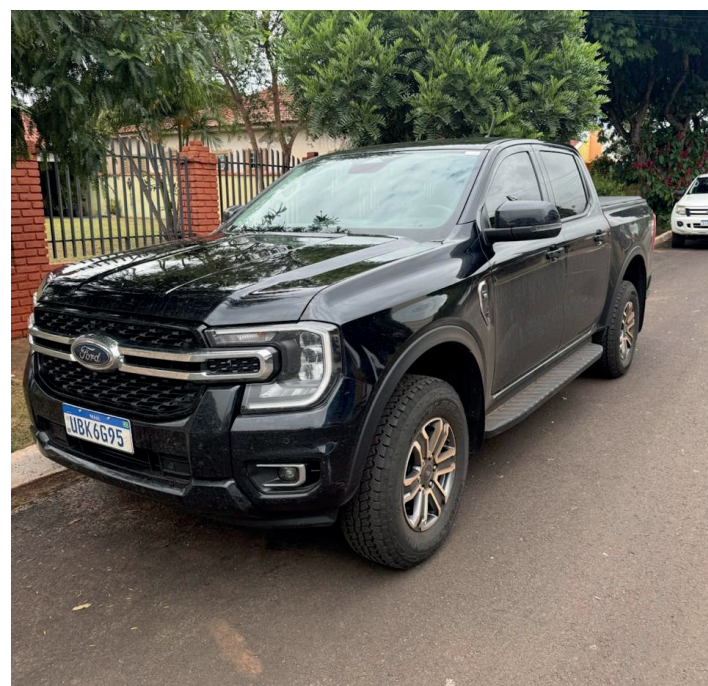
Ford Ranger, no valor de R$ 330 mil