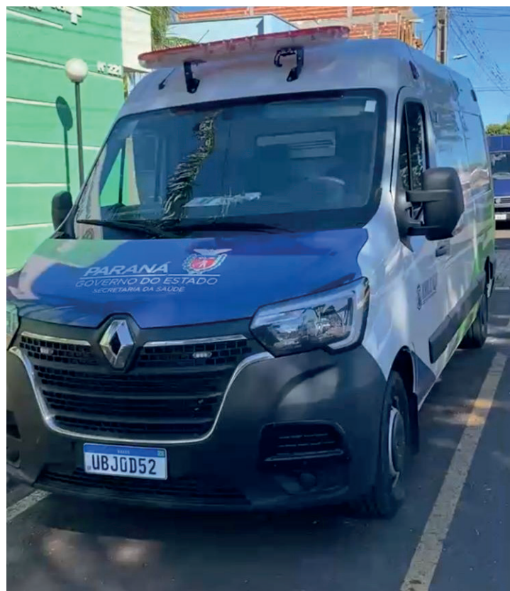
Ambulância Renault Master, no valor de R$ 320 mil

oferecer serviços públicos cada vez mais modernos, eficientes e preparados para acompanhar o desenvolvimento do município.