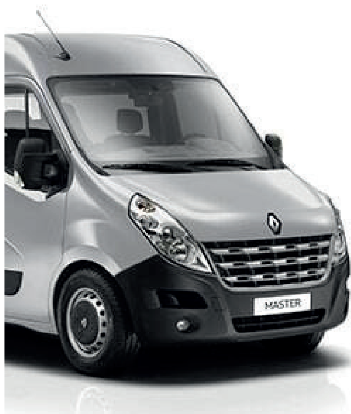
Van com capacidade para 16 passageiros, no valor de R$ 320 mil (foto ilustrativa)