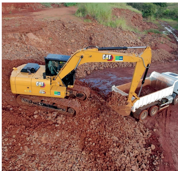
Escavadeira Hidráulica, no valor de R$ 730 mil