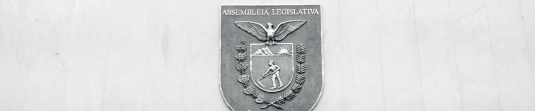
Estado apresenta Plano Decenal do Esporte e Relatório de Gestão na Assembleia Legislativa.