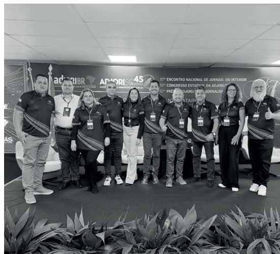
Participação de membros da ADJORI / PR no evento