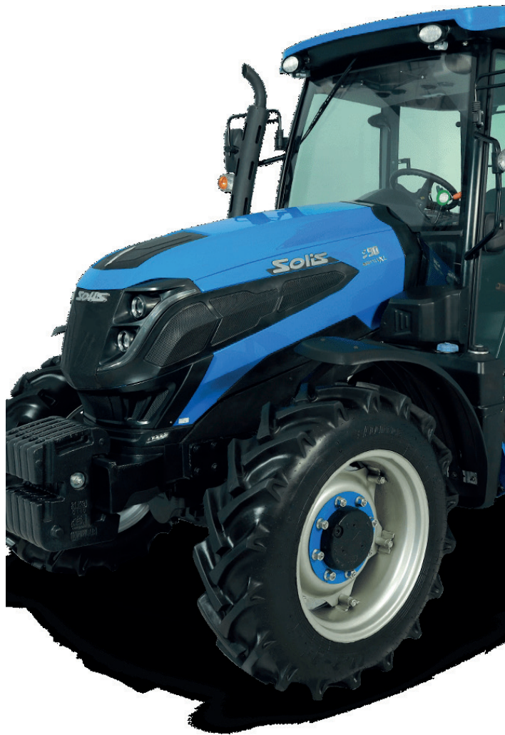
Trator, no valor de R$ 415 mil (foto ilustrativa)