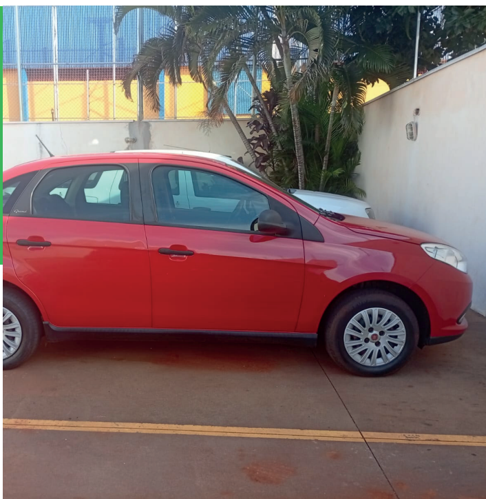
Veículo Fiat Grand Siena Attractive 1.0 Flex, ano 2018, no valor de R$ 44.440,00, doado pela Receita Federal