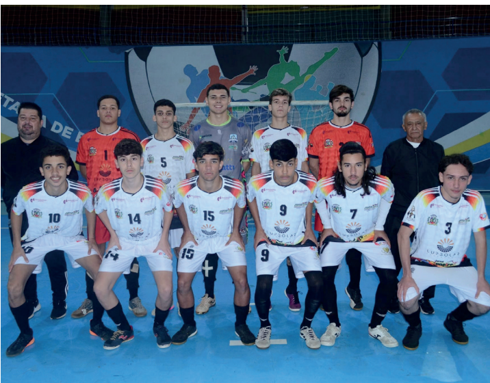
A equipe masculina de futsal de Lupionópolis sagrou-se campeã da Fase Regional dos JOJUPS (Jogos da Juventude do Paraná), realizado no município de Rolândia em duas etapas: de 04 a 07 e de 18 a 21 de junho. A grande final foi contra a forte equipe de Apucarana. Com o empate em 3 x 3 no tempo normal de jogo, a decisão foi para os pênaltis. Lupionópolis levou a melhor e levantou o caneco. O jogo decisivo aconteceu no dia 21/06, no Ginásio de Esportes Emilio Gomes.