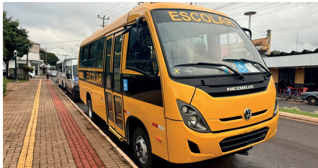
Ônibus Escolar, no valor de R$ 422 mil, emenda da deputada federal Luisa Canziani