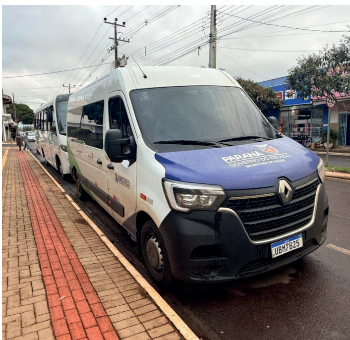
Van, no valor de R$ 298 mil