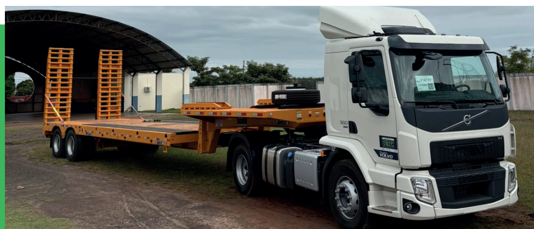
Caminhão Prancha, no valor de R$ 748 mil