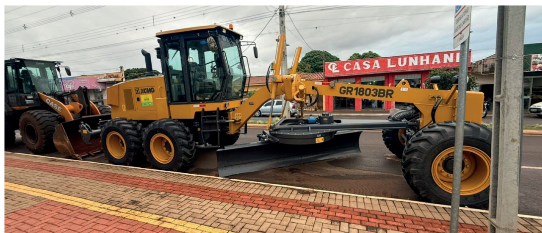
Motoniveladora, no valor de R$ 625 mil, emenda do deputado federal Luiz Nishimori