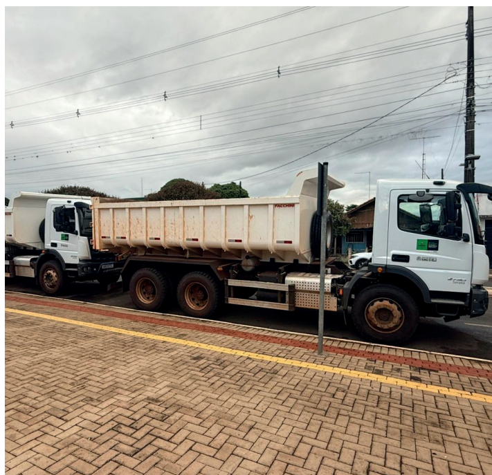
Dois caminhões Caçamba 6x4, no valor de R$ 1,2 milhão