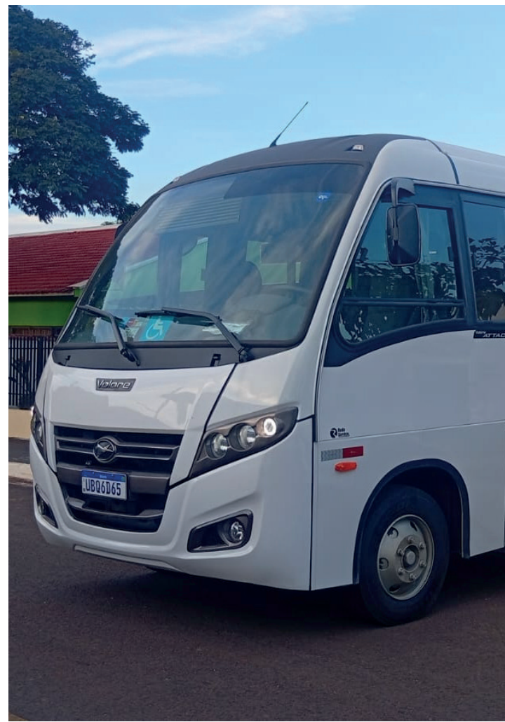
Ônibus Rodoviário, no valor de R$ 659 mil