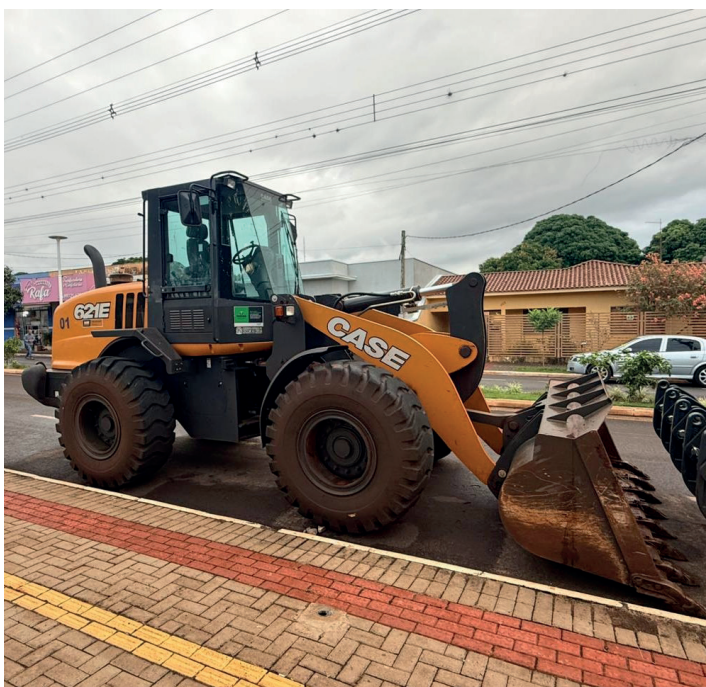
Dois pás carregadeiras, no valor de R$ 1,5 milhão