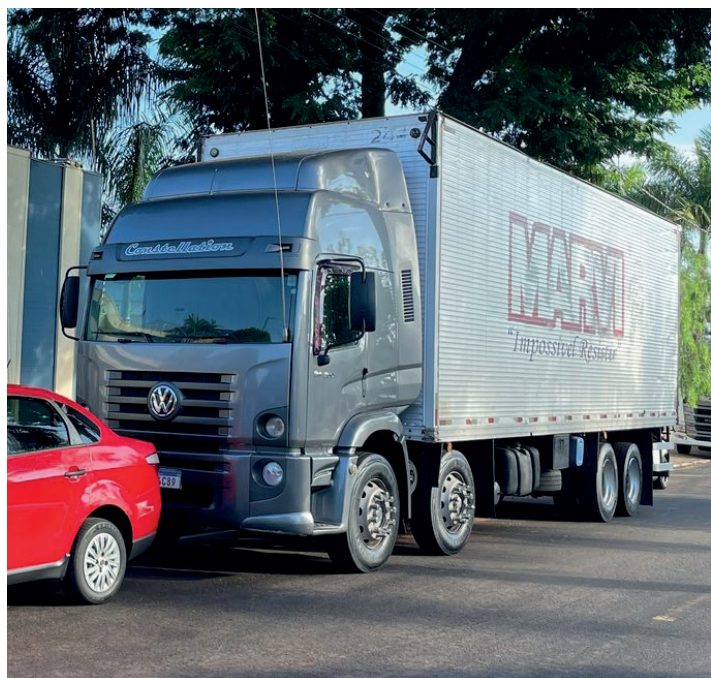
Caminhão furgão Volkswagen/24.250 CLC 6X2, ano 2009, no valor de R$ 192.448,00, doado pela Receita Federal, vendido para aquisição de um veículo para a gestão

servidores e mais agilidade no atendimento às demandas da população. Além de reduzir os gastos com manutenção de veículos antigos, a