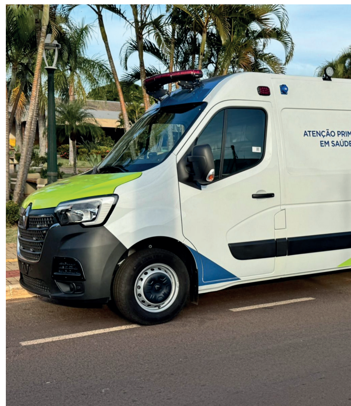
Ambulância modelo SAMU, no valor de R$ 322 mil