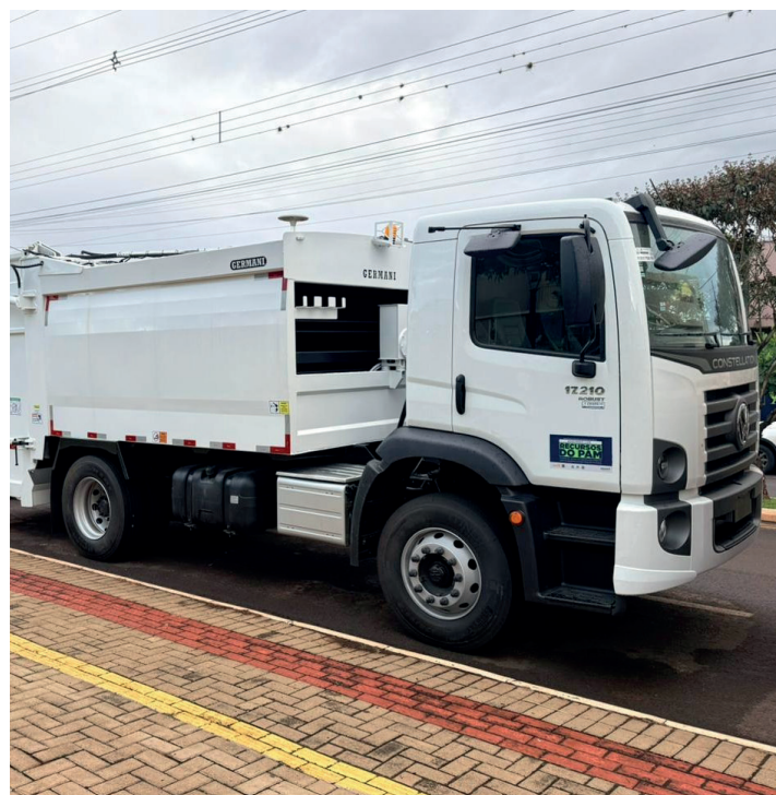
Caminhão Compactador de Lixo, no valor de R$ 502 mil