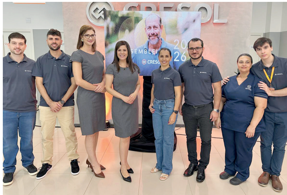
Foi realizada no dia 10 de abril, na Cresol, a Assembleia de Relacionamento da Agência de Santa Fé, reunindo cooperados e lideranças locais em um importante momento de diálogo e transparência. O encontro reforçou a participação dos associados nas decisões da cooperativa, além de apresentar resultados, metas e perspectivas, fortalecendo ainda mais o compromisso com o desenvolvimento econômico e social da comunidade.