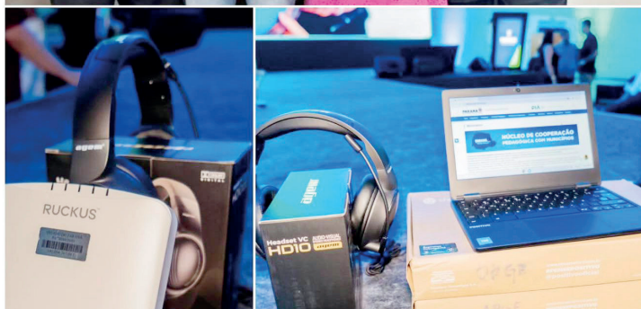
A entrega do kit tecnológico foi feita pelo deputado estadual Adriano José

O dia 27 de março marcou um importante avanço para a educação de Nossa Senhora das Graças, com a entrega de um kit tecnológico completo à Escola Municipal Francisca Sabino Ruiz. A iniciativa reforça o compromisso do município com a mo-