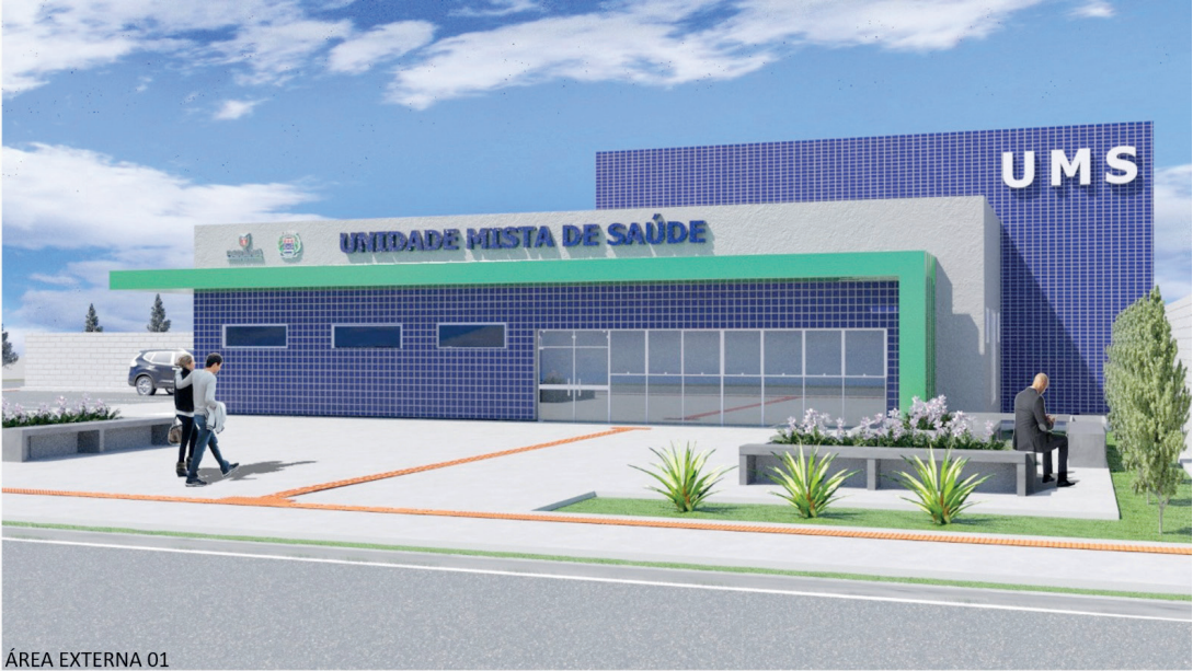
ÁREA EXTERNA 01

A obra representa um investimento histórico de R$ 4,5 milhões, viabilizado pela Secretaria de Saúde do Estado, ampliando o acesso, a qualidade e o cuidado com a saúde da população.