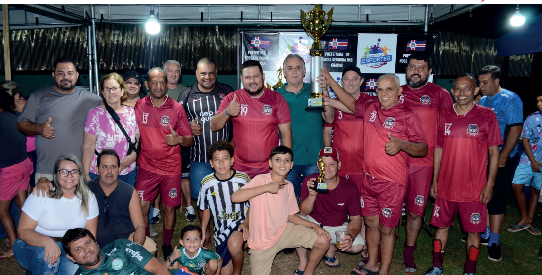
Entrega de troféu para a equipe campeã, Amigos do Leitinho.