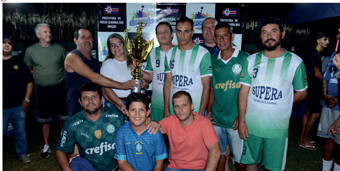
Entrega de troféu para a equipe vice-campeã, Amigos do Wilson.