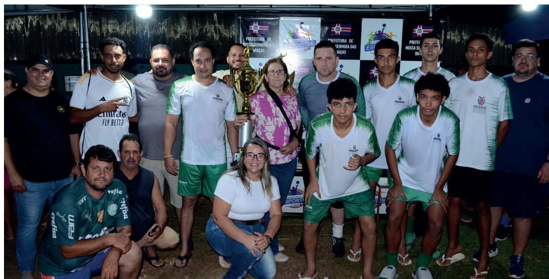
Entrega de troféu para a equipe vice-campeã, Família Aguiá.