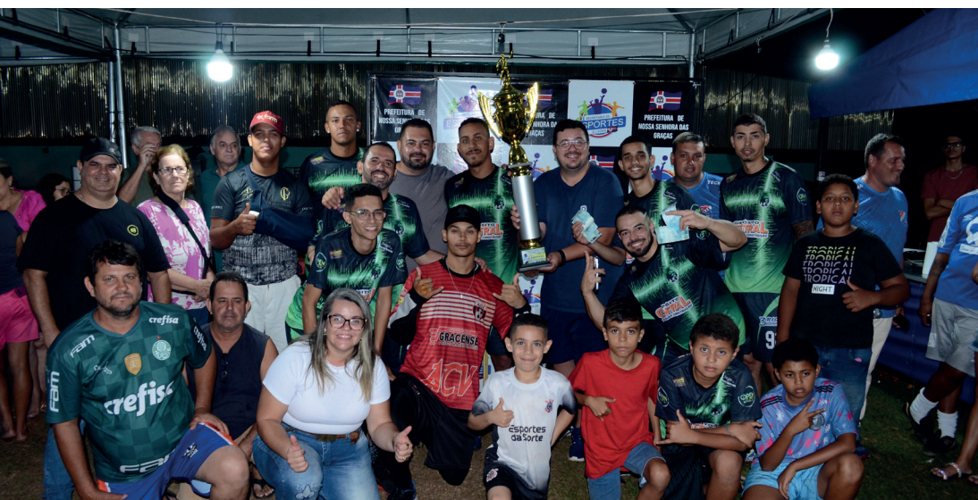
Entrega de troféu para a equipe campeã, Crias do Noel.