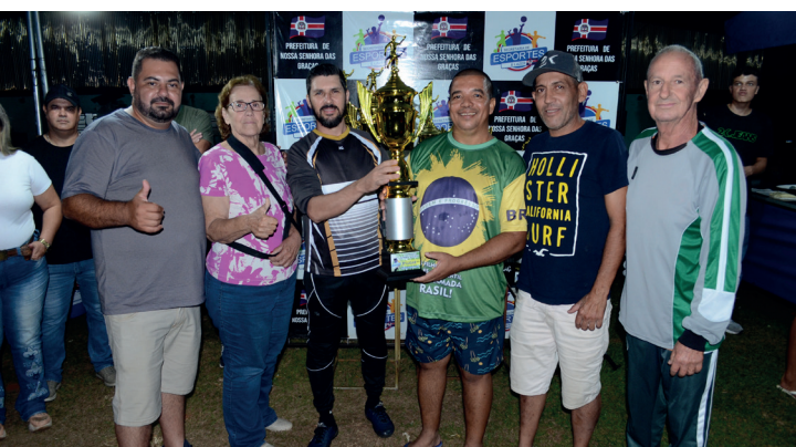
Entrega de troféu para o terceiro colocado, Amigos do Loro.