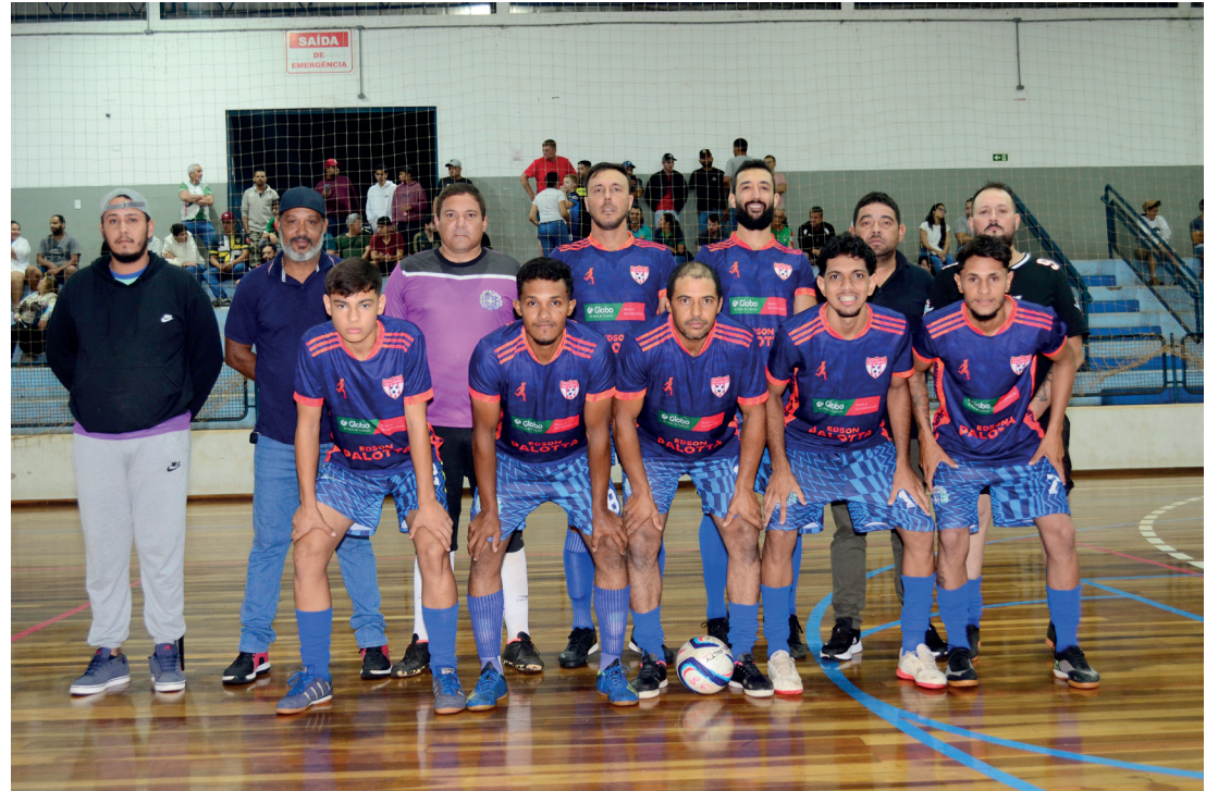
Equipe vice-campeã: RR dos Reis / Globonet.