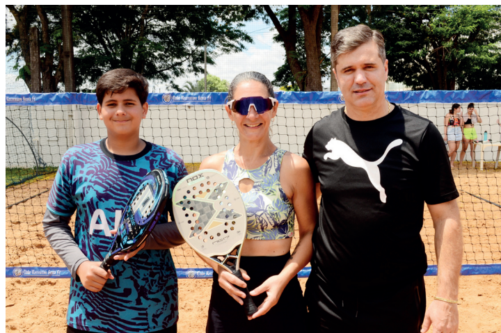
Duplas de beach tennis foram premiadas