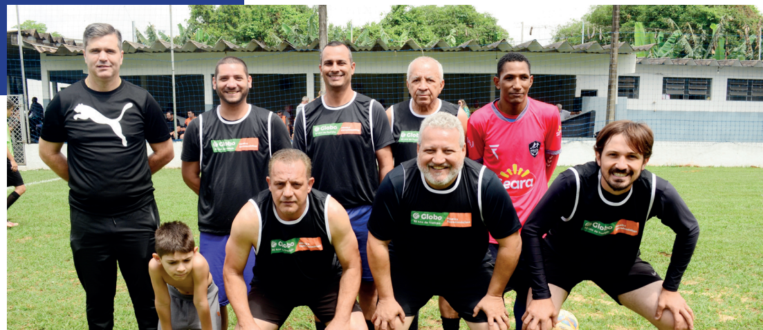
O torneio de futebol suíço na categoria adulto reuniu a participação de quatro equipes.