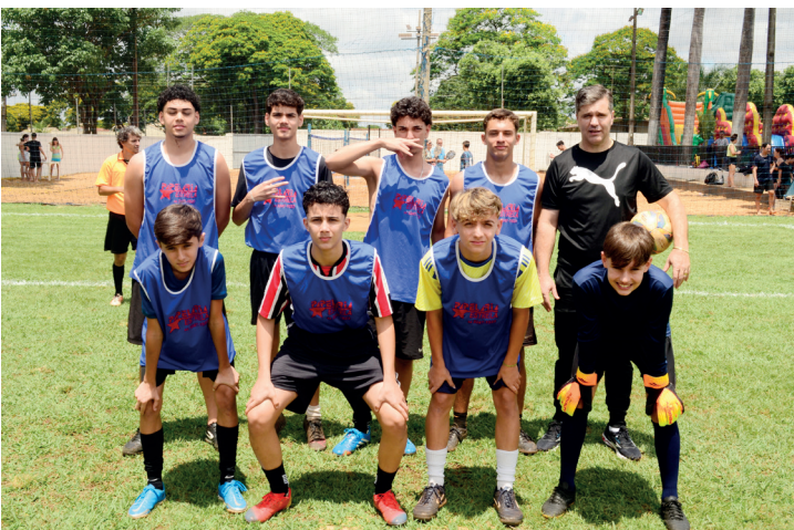
A categoria juvenil contou com duas equipes