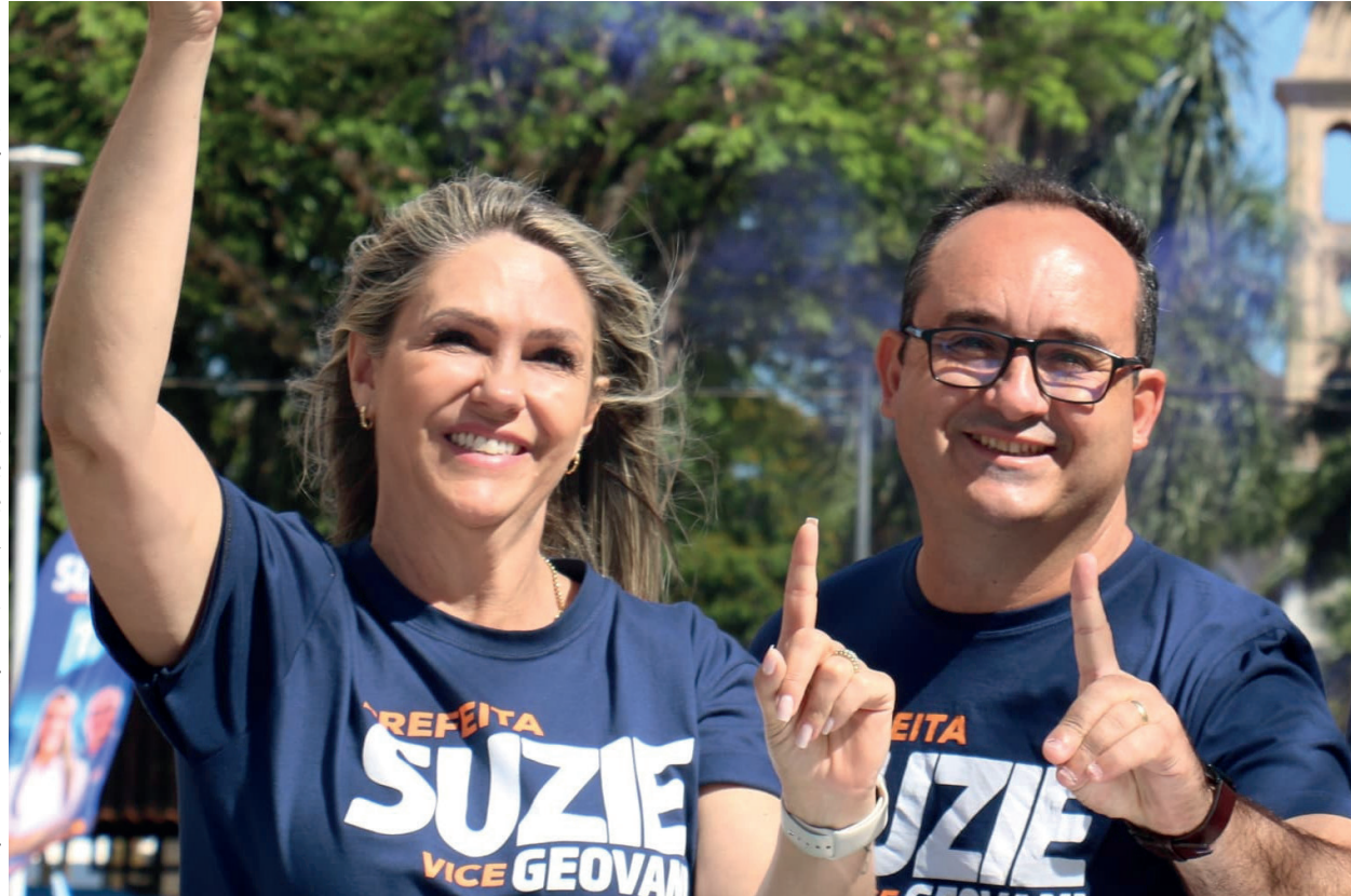
Prefeita Suzie Pucillo e o vice-prefeito Geovani Conti comemoram a vitória.

de monitoramento de câmeras, inclusive para a Zona Rural. São várias ações que nós já estamos trabalhando e lutando e tenho certeza que iremos conseguir concluir no próximo mandato.