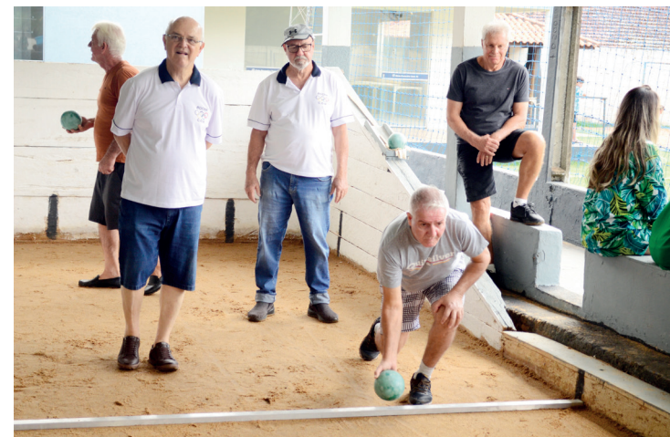
A reabertura do clube também contou com torneio de bocha.