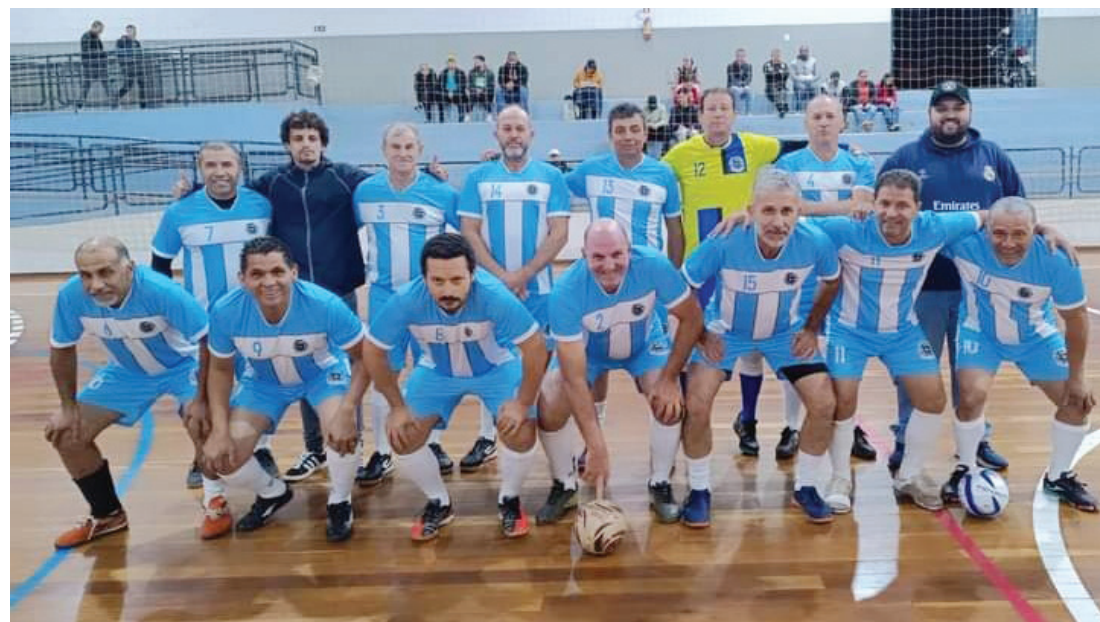
Equipe de futsal Santa Fé

ro e quarto lugar será entre Santa Fé e Londrina. As partidas finais serão realizadas no Ginásio de Esportes José Brambilla a partir das 19h. A entrada é franca.