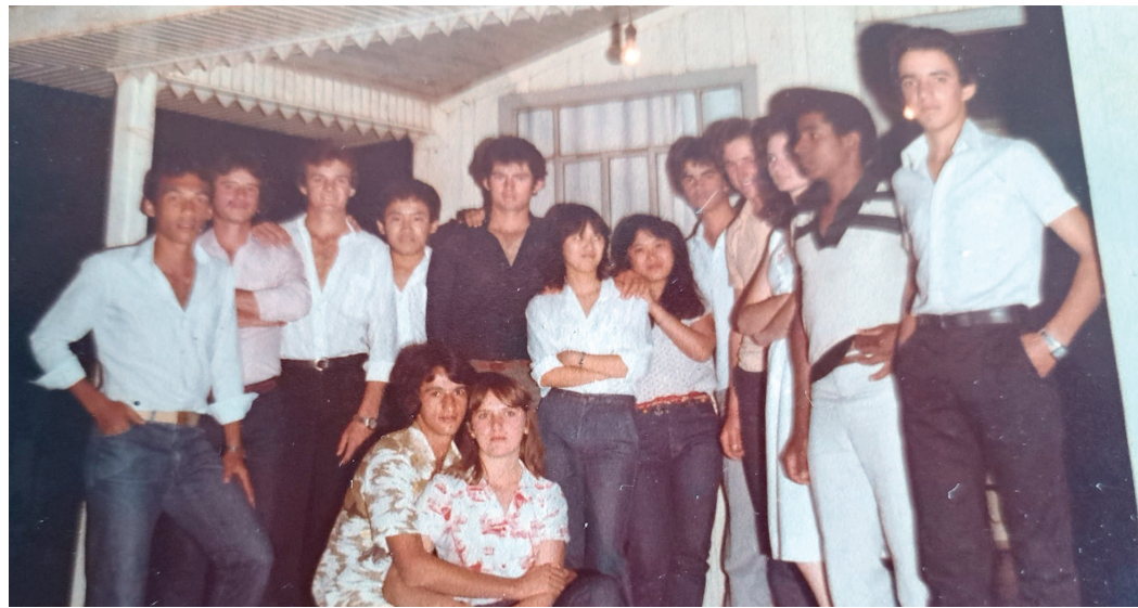
Formandos de Contabilidade de Santa Fé