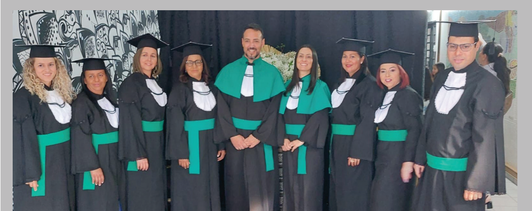
Cerimonial Social de Conclusão dos Cursos Técnicos do Programa Saúde com Agente do município de Iguaraçu