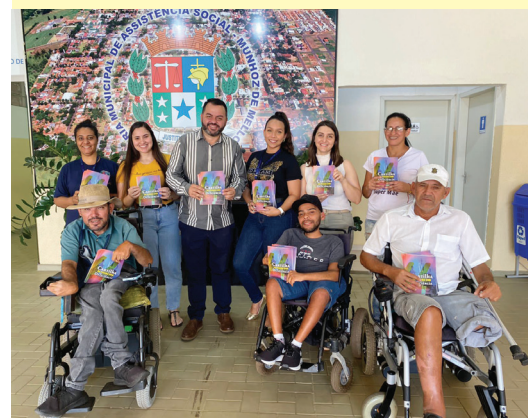
Reunião com o poder executivo

"Como as aves, as pessoas são diferentes nos seus vôos, mas iguais no direito de voar."