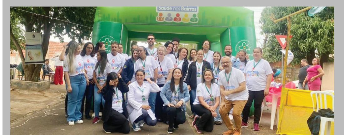
Equipe da UBSF (Unidade Básica de Saúde da Família) no evento Saúde nos Bairros, no Jardim União, em Iguaraçu-Copacabana e equipe eMulti,