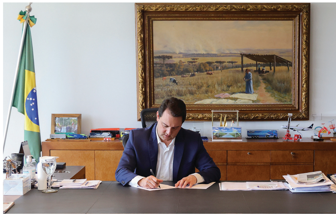
Governador anuncia nomes das Secretarias da Mulher e Igualdade Racial e Comunicação