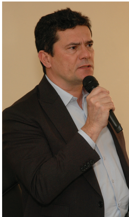
Moro está fazendo um tour nos pequenos municípios do Paraná e se prepara para lançar sua candidatura ao Senado – pelo União Brasil.