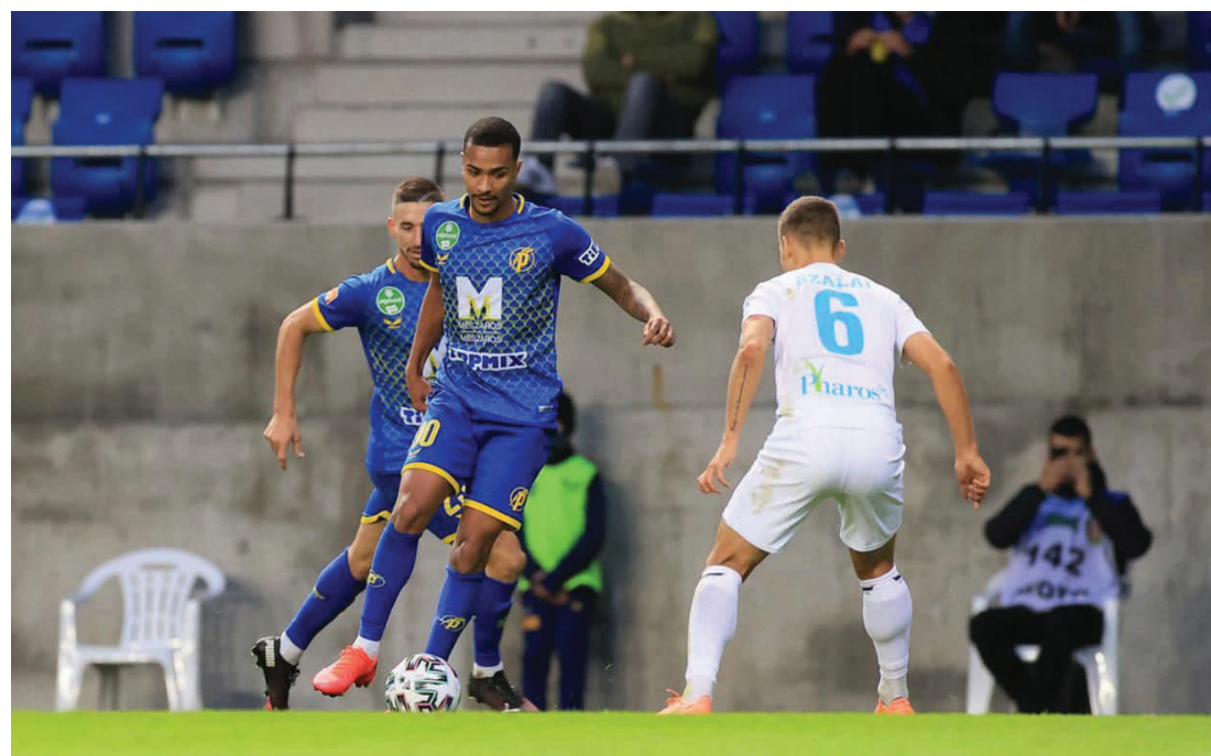
O atacante é destaque no time Puskás Akadémia, da Hungria.