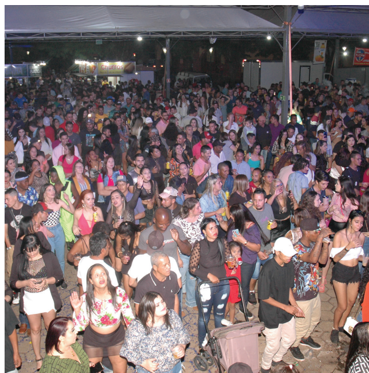
Vista parcial do público no sábado, (23/07).