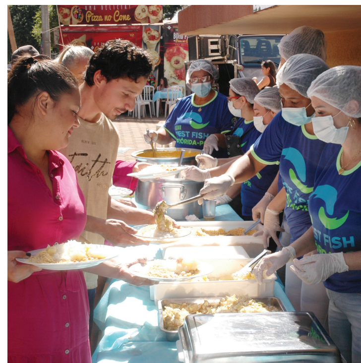
Almoço oferecido gratuitamente para toda a população de Flórida.