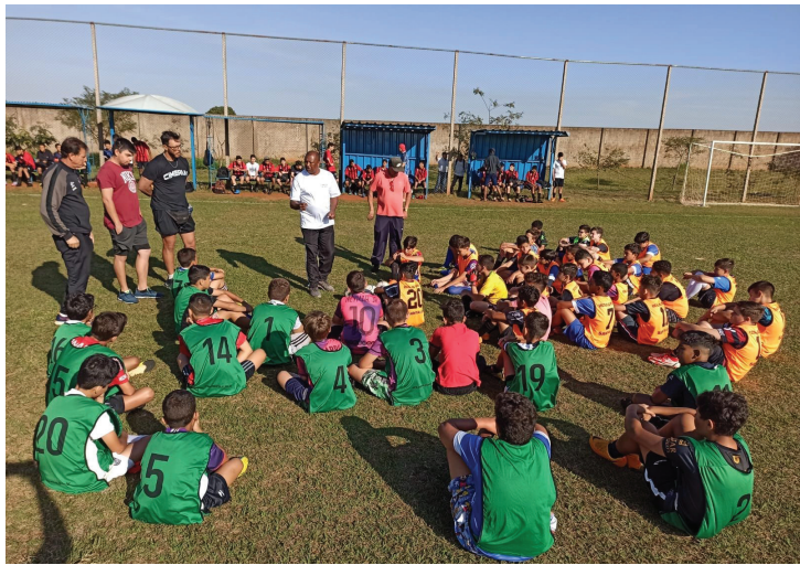
Mais de 100 garotos participaram da avaliação

escolinha de futebol e de outras cidades que compareceram para esta avaliação e também o apoio da Prefeitura Municipal de Santa Fé e Secretaria de Esporte, Lazer e Turismo.