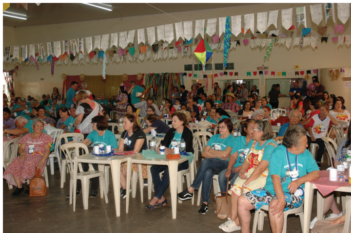
O 1º Encontro Microrregional da Pessoa Idosa reuniu participantes dos municípios de Ângulo, Santa Fé, Lobato e Flórida.