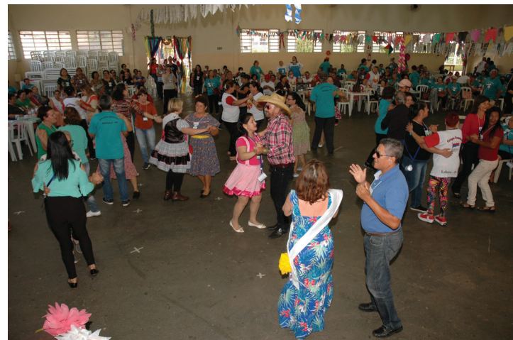
O evento contou com baile no período da tarde