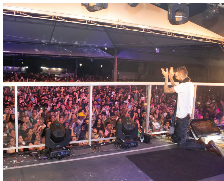
A sexta-feira, (22/07), teve recorde de público com a apresentação do cantor Luan Pereira.