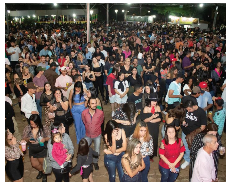
A Defesa Civil estimou a presença de aproximadamente 7 mil pessoas no primeiro dia de festa.