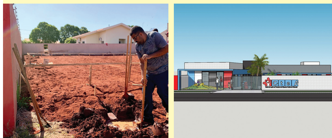
Início dos trabalhos para a construção do Centro de Apoio ao Transtorno do Espectro Autista de Colorado.

zado, proporcionando oportunidades para o desenvolvimento de crianças com o Transtorno do Espectro Autista.