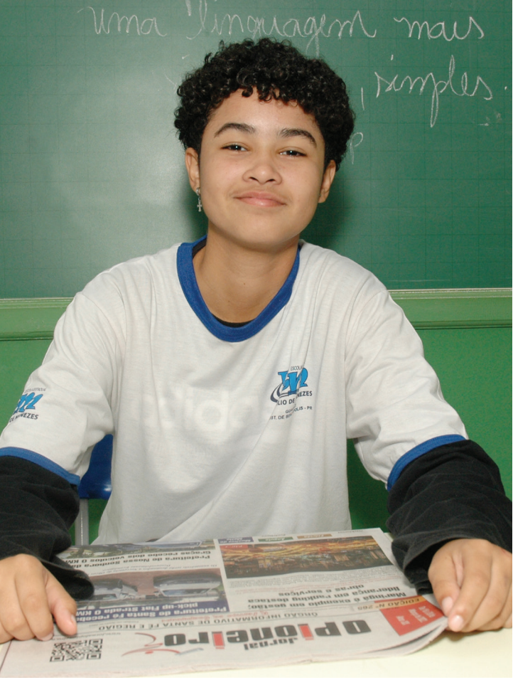
Bentópolis, 10 de março de 2022 Prezado editor