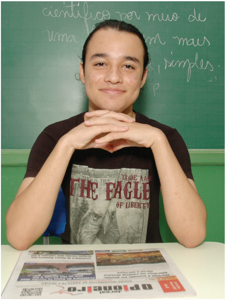
Bentópolis, 10 de março de 2022 Prezado editor