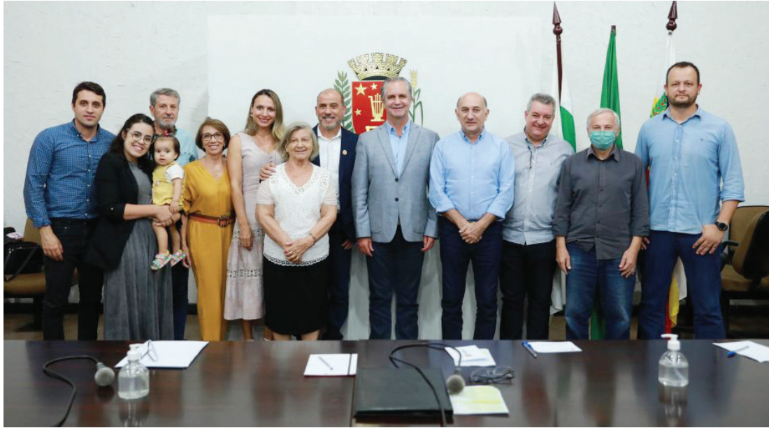
Presença da família e momentos emocionantes