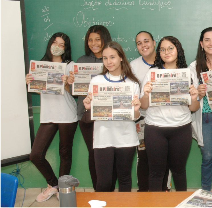
Alunos do 9º ano, da Escola Estadual Emílio de Bentópolis, acompanhados da professora