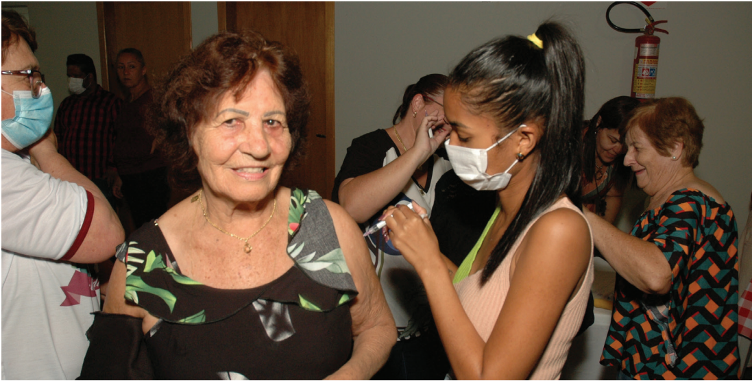
Durante o evento foi realizada a vacinação contra a gripe para pessoas acima de 60 anos de idade