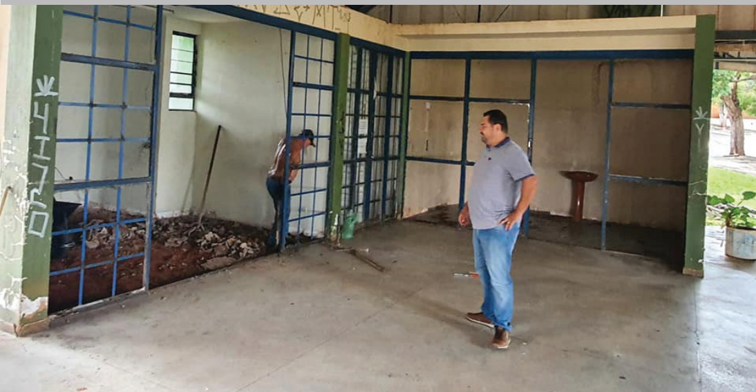
O prefeito Clodoaldo Rigieri está acompanhado de perto a reforma da Rodoviária.