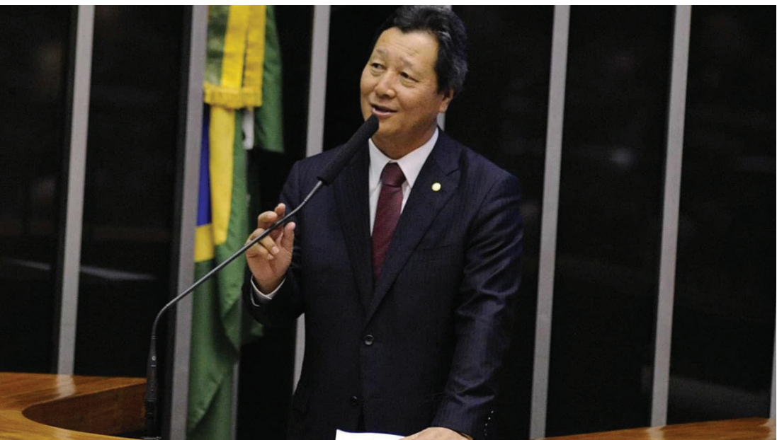
Deputado federal Luiz Nishimori.

A Delegacia da Receita Federal em Maringá efetuou, no ano de 2021, 109 destinações a órgãos públicos e organizações da sociedade civil, mesmo com número bastante reduzido de servidores. Seria possível fazer mais destinações, beneficiando a sociedade, se novos servidores fossem contratados.