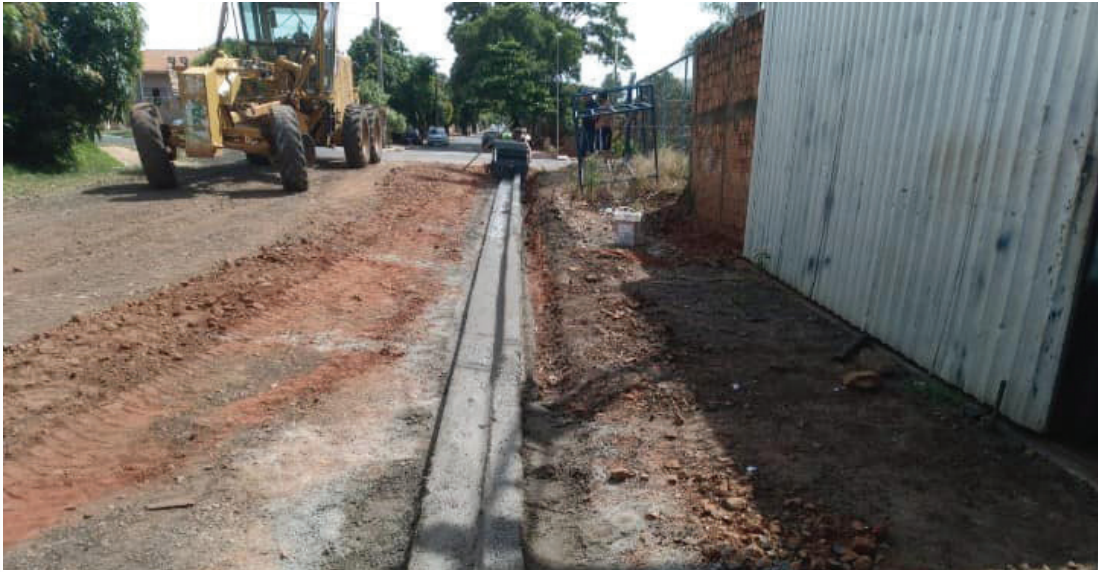
Construção de meio-fio.