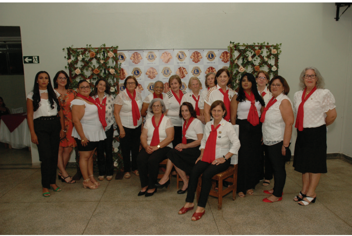
Companheiras e domadoras.

sentes. “É uma honra este estimado clube de serviços contar com novos companheiros, que a partir de agora passam a integrar o Lions Clube de Santa Fé”, enfatizou.