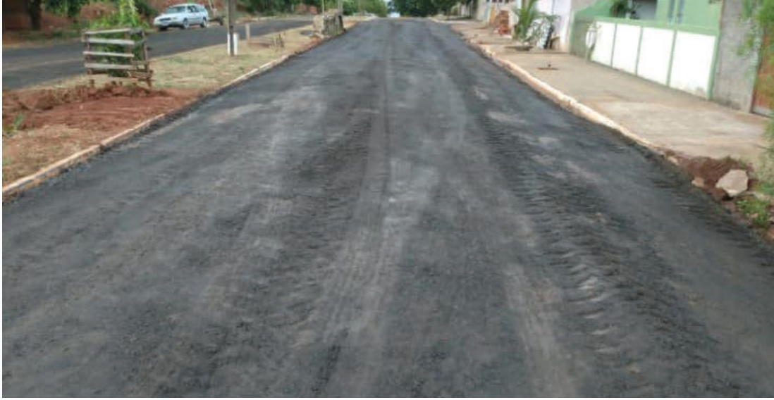
Aplicação de material fresado.

Rigieri, esta é uma alternativa econômica para a prefeitura e que traz resultados positivos.