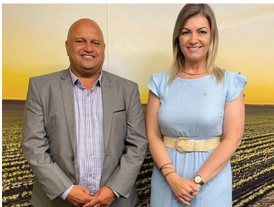
Prefeito Eliseu Costa e deputada federal Aline Sleutjes.