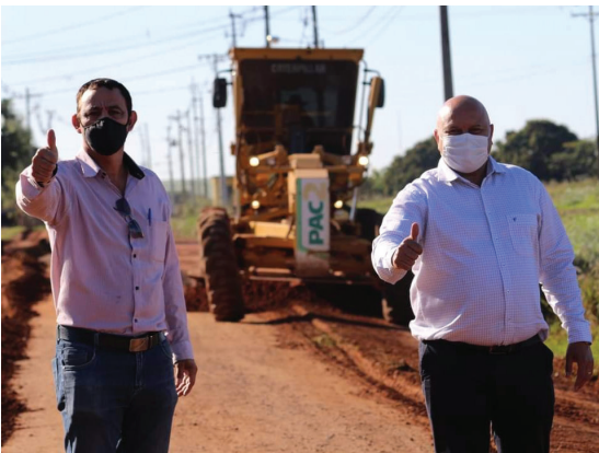
Vale lembrar que no início do ano foi feito o nivelamento, novas lombadas e adequações para futuramente ser aplicado o asfalto.