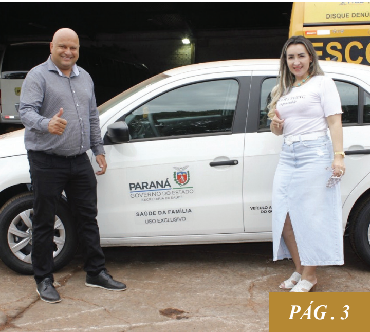
Na foto o prefeito Eliseu Costa e primeira dama Eliana Ribeiro

Município de Iguaçu é contemplado com veículo O KM